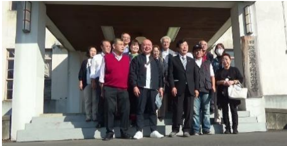
旧筑波海軍航空隊司令部庁舎前にて